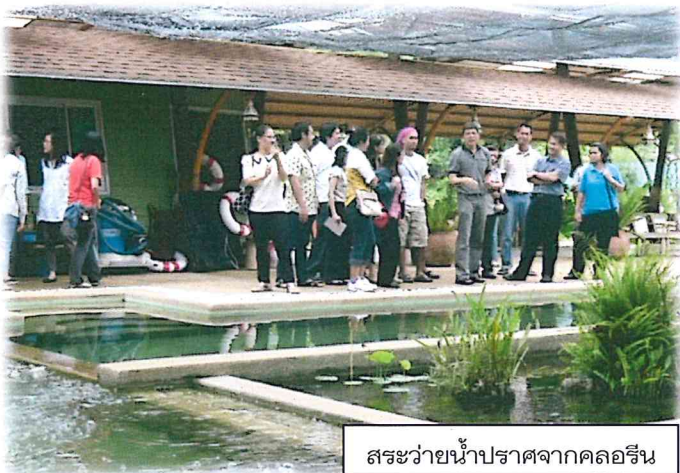
สระว่ายน้ำปราศจากคลอรีน