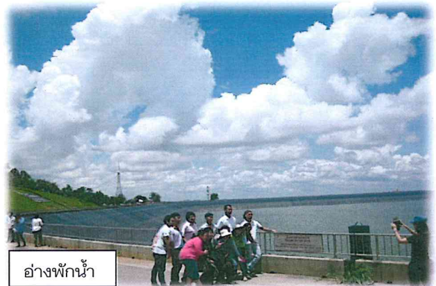
อ่างพักน้ำ