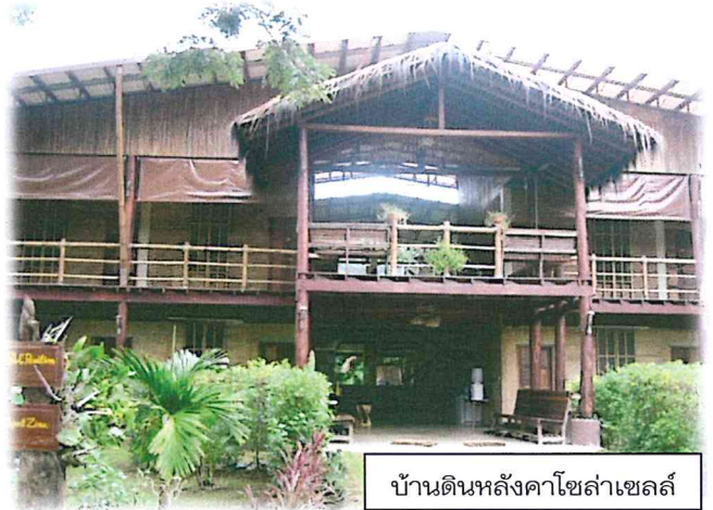
บ้านดินหลังคาโซล่าเซลล์