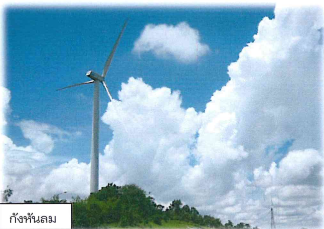
กังหันลม

โดยได้มีโอกาสเยี่ยมชมกังหันลมที่มีขนาดใหญ่ที่สุดของประเทศไทยจำนวน 2 ชุด ซึ่งใช้งบประมาณ 145 ล้านบาท ที่ผลิตไฟฟ้าได้ประมาณ 4.60 ล้านหน่วยต่อปี