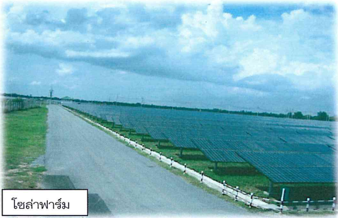
โซล่าฟาร์ม