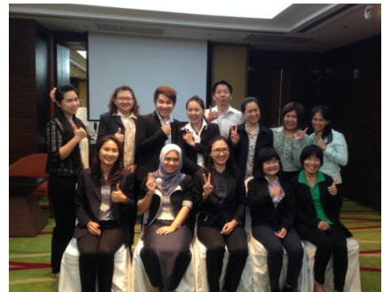
ตัวอย่างความประทับใจของผู้เข้าร่วมต่อหลักสูตรนี้

ท้ายสุดวิทยากรย้ำความหมายของการสื่อสารไว้ว่า คือ การตอบสนองที่ได้รับ โดยไม่สนว่าความตั้งใจในการสื่อสารคืออะไร ต่อให้มีความตั้งใจดีแต่ท่าทาง น้ำเสียง อากัปกิริยา ไม่สัมพันธ์กัน ก็ก่อให้เกิดความเข้าใจผิดแปลกไปจากเจตนาแรกของผู้สื่อได้ ดังนั้นเราควรใส่ใจกับสิ่งที่เราจะพูดที่เราต้องการจะสื่อสาร บวกกับน้ำเสียง สีหน้า ท่าทาง ให้ทุกอย่างดูสอดคล้องสัมพันธ์กันด้วย 🌟