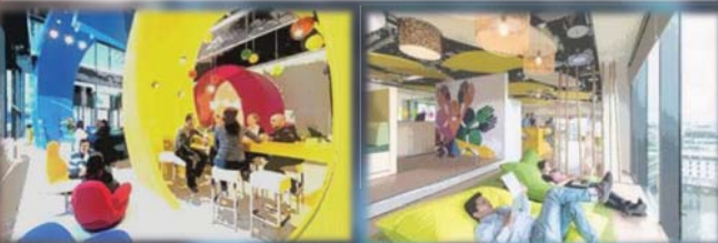
รูปภาพ 1

"ว้าววว !!! ทำไมห้องนี้ดูหรูหราร่าง" เสรีรำพึงอย่าง ประหลาดใจ พลังเดินสำรวจภายในห้องดังกล่าว