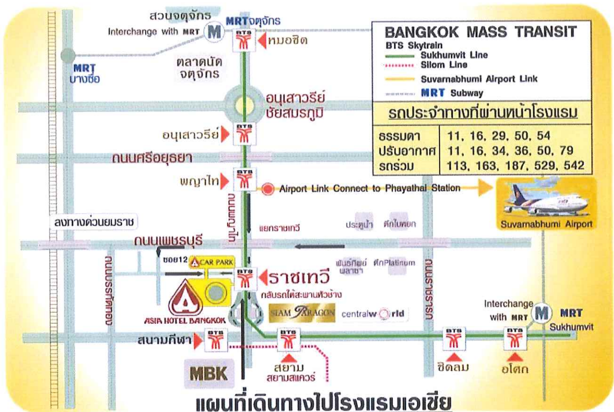
แผนที่โรงแรมเอเชีย

โรงแรมเอเชีย กรุงเทพฯ 296 ถนนพญาไท ราชเทวี กรุงเทพฯ เชื่อมต่อรถไฟฟ้าราชเทวี โทร. 02-217-0808